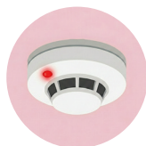
火災報知機の点検

下記の職種はあくまで一例です。ご自身の職種が対象かご不安な方は、当団体にお声がけください。