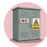
キュービクルの清掃